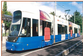
スイス・ジュネーブ「シティ・ランナー」