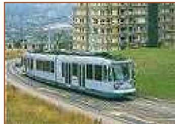
イギリス・ジェフィールド