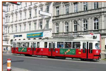
オーストリア・ウィーン