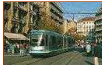
フランス・グルノーブル